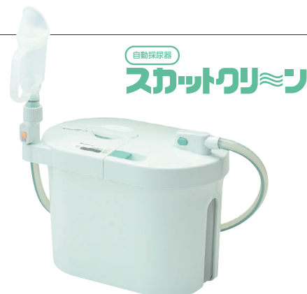
画像は男性用レシーバー装着済みのもの

スカットクリーンは、尿意の自覚があり、ご自分で、または介護する方の手助けによりレシーバーをあてがうことができる方にご利用いただけます。＊尿意の自覚のない方、尿が常に出続ける方はご利用になれません。＊大便には利用できません。